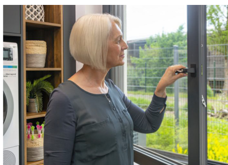
Nach dem Fenstertausch ist ein ausreichender Luftwechsel in der Wohnung und ein Mindestwärmeschutz an der Wand nötig.

Neue Fenster sind bei fachgerechtem Einbau wesentlich dichter als alte Fenster, die oft verschlissene Dichtungen haben und häufig auch verzogen sind. Nach der Modernisierung entweicht durch den dichteren Anschluss an die Wand weniger Luft über die Fugen. Das hat den Vorteil, dass im Winter die warme Raumluft im Hausinneren bleibt und unerwünschte, zu hohe Wärmeverluste vermieden werden. Die dichteren Fenster verhindern aber auch, dass die verbrauchte, feuchte Raumluft durch frische, trockene Luft ersetzt wird. Zuvor konnte die feuchte Luft über die undichten Fugen der alten Fenster unkontrolliert entweichen.