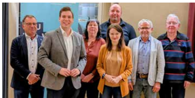
Vorstand des CDU Gemeindeverbandes Iller-Weihung

Der CDU-Gemeindeverband Iller-Weihung hielt seine turnusmäßige Mitgliederversammlung ab, bei der auch die Neuwahlen des Vorstandes auf der Tagesordnung standen. Die bisherigen Vorstandsmitglieder wurden in ihren Ämtern bestätigt, was die Kontinuität und das Vertrauen innerhalb des Verbandes unterstreicht. Der neue Vorstand setzt damit auf bewährte Zusammenarbeit und ein geschlossenes Auftreten in der Region.