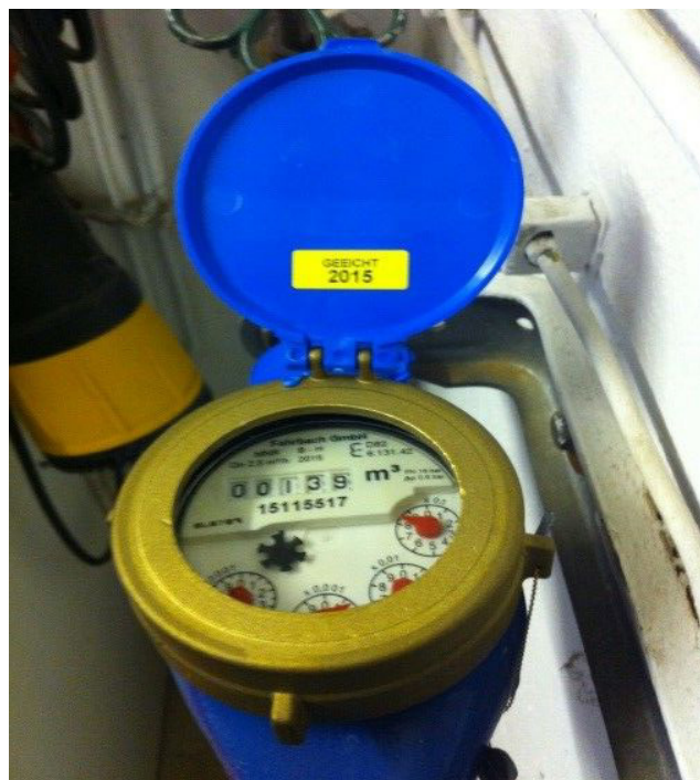
Die Wasseruhr auf diesem Bild wurde im Jahr 2015 geeicht, erkennbar am länglichen Aufkleber mit der Info "geeicht". Der Austausch ist nach 6 Jahren fällig, dieser Wasserzähler wurde also 2021 erneuert.

Aktuelle Informationen aus Ihrer Nähe – Ihr Mitteilungsblatt. Empfehlen Sie uns weiter.