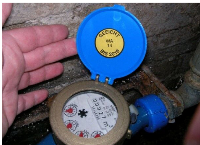
Die Wasseruhr auf diesem Bild war bis zum Jahr 2016 geeicht. Erkennbar am runden Aufkleber und der Info: „geeicht bis“

Bitte beachten Sie dabei, dass bei uns Wasseruhren mit unterschiedlichen Kennzeichnungen im Umlauf sind: