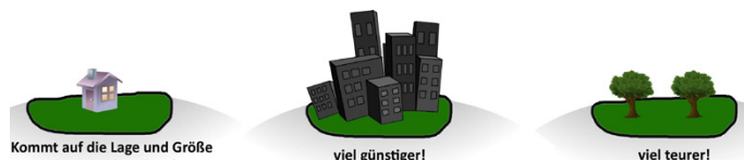
Schaubild: Auswirkungen der Grundsteuerreform auf Grundstücke gleicher Lage und Größe:

Durch die neue Systematik der Berechnung, bei der hauptsächlich auf die Größe und den Bodenrichtwert des Grundstücks abgestellt wird, wird es Eigentümer geben, die nach der Reform mehr Grundsteuer bezahlen als davor und gleichzeitig welche, die nach der Reform weniger zahlen als davor. Bisher spielte bei der Bemessung vor allem der Wert der Immobilie eine entscheidende Rolle. Das heißt, wer bisher Eigentümer einer wertvollen Immobilie auf einem kleinen Grundstück war, musste verhältnismäßig hohe Grundsteuerern bezahlen, während ein Eigentümer einer weniger wertvollen Immobilie auf einem großen Grundstück eine verhältnismäßig geringe Grundsteuer zu zahlen hatte. Da nun, wie beschrieben, der Grundsteuermessbetrag hauptsächlich vom Bodenrichtwert und der Grundstücksgröße und eben nicht mehr vom Wert der Immobilie abhängig ist, dreht sich dieses Verhältnis um. Da die Bodenrichtwerte in unseren Teilorten Beuren und Ammerstetten geringer sind, wie in Schnürpflingen, hat dies auch zur Folge, dass in den Teilorten - immer vorausgesetzt die Grundstücke sind gleich groß - die Grundsteuer verhältnismäßig günstiger ist.