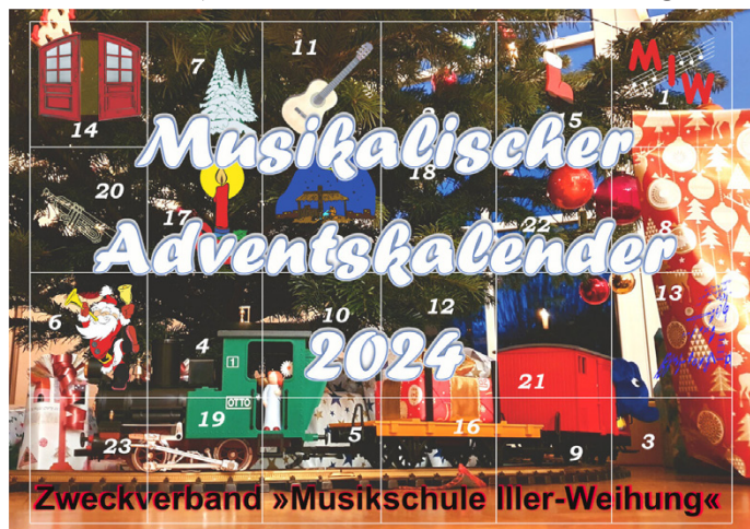
Musikalischer Adventskalender 2024

Schülerinnen, Schüler und Lehrkräfte der Musikschule Iller-Weihung stimmen auf die festliche Zeit ein und halten ab dem 1. Dezember hinter jeder Tür eine musikalische Überraschung bereit.